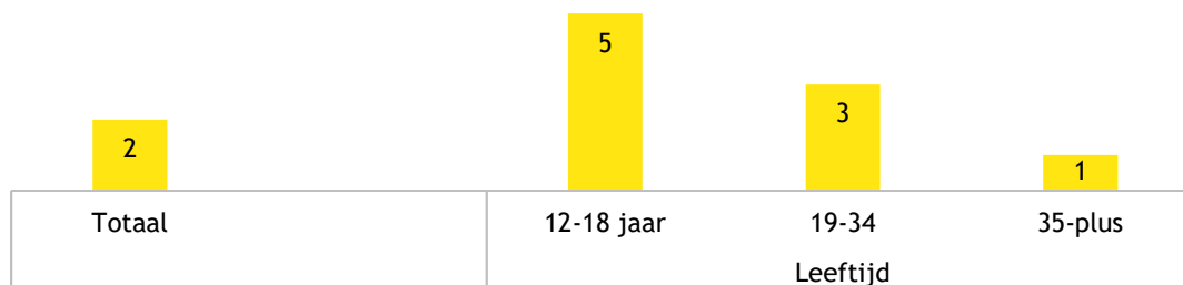
Figuur 2.1 Wekelijkse deelname vechtsport Nederlandse bevolking 12-79 jaar 2013-2015 (n=27.867; in procenten)

Bron: Gezondheidsenquête CBS 2013 en Gezondheidsenquête/Leefstijlmonitor CBS i.s.m. RIVM 2014-2015 (secundaire analyse: Mulier Instituut, 2016)